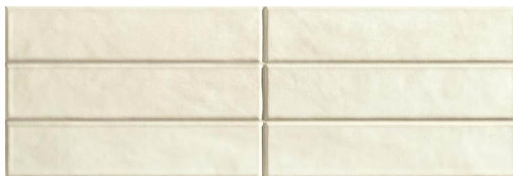
Ground Force White