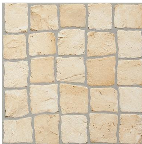
Chiado Bege CH20